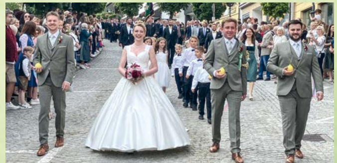
Das Pfingstbrautpaar 2025 und seine Begleiter beim Burschen- und Brautzug

Gemeinsam mit den Burschen zieht dann das Pfingstbrautpaar grüßend durch die festlich geschmückte Stadt zum Hotel „Zur Post“, wo die Pfingsthochzeit gefeiert wird. Die Pfingsthochzeit hat nur symbolischen Charakter. Die Pfingstbraut und die Brautführer müssen wie der Pfingstbräutigam ledig, katholisch und in der Stadt Bad Kötzing wohnhaft sein.