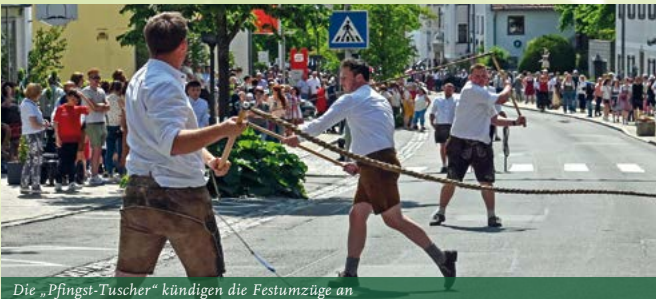
Die „Pfungst-Tuscher“ kündigen die Festumzüge an