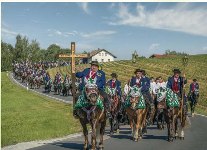
Reiterprozession am Pfingstmontag