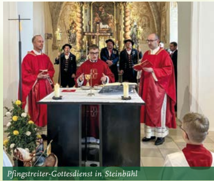
Pfingstreiter-Gottesdienst in Steinbühl