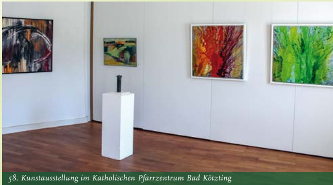
58. Kunstausstellung im Katholischen Pfarrzentrum Bad Köztzing

während der Pfingstferien (26.05. – 05.06.2026) von 10 – 17 Uhr