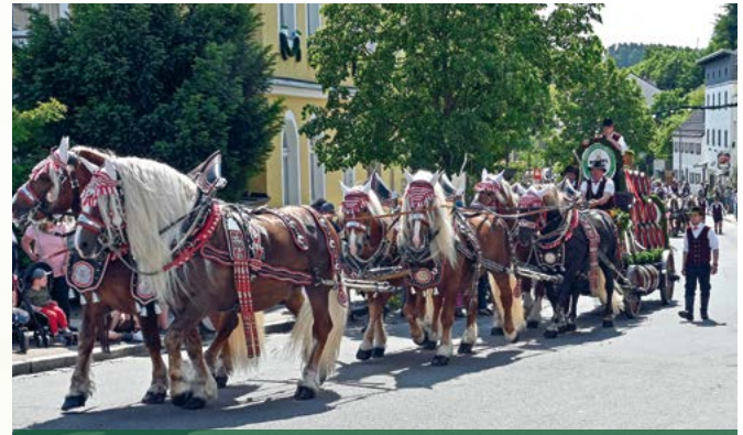
Festzug zur Volksfest-Eröffnung