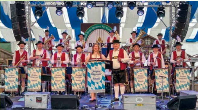
Festkapelle „Die Weiß-Blau Königstreuen“