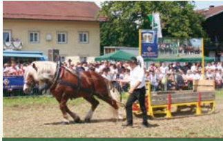
Zugleistungswettbewerb der starken Rösser