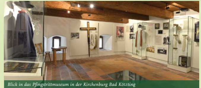
Blick in das Pfingstrittmuseum in der Kirchenburg Bad Köztzing