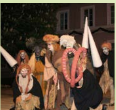
Pfungstl-Spiel in der Innenstadt