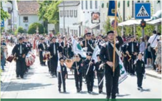
Spielmanszug der FFW Bad Kötzting

„Pfungstfreud' ist ins Land gezogen Volk schließ deine Herzen auf“