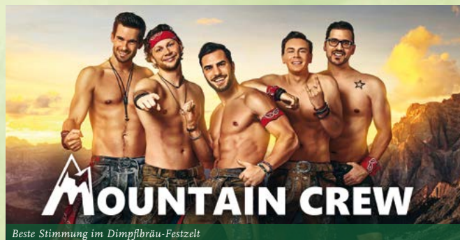
Beste Stimmung im Dimpflbräu-Festzelt